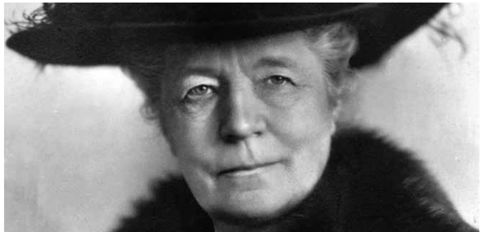
Den svenske forfatter Selma Lagerlöf (1858-1940) fik Nobelprisen i litteratur i 1909

den nærmede sig bålet kiggede hyrden op. Det var en gammel og gnaven hyrde – hård og uvenlig over for alle mennesker. Og da hyrden så den fremmede komme, greb han en lang, spids stav, som han plejede at holde i hånden, når han vogtede sin hjord, og kastede den efter den fremmede. Og hvinende fór staven lige mod manden, men inden den ramte ham, bøjede staven af og susede forbi ham langt ud over marken. Manden sagde til hyrden: "Kære – hjælp mig og lad mig låne noget ild. Min kone har